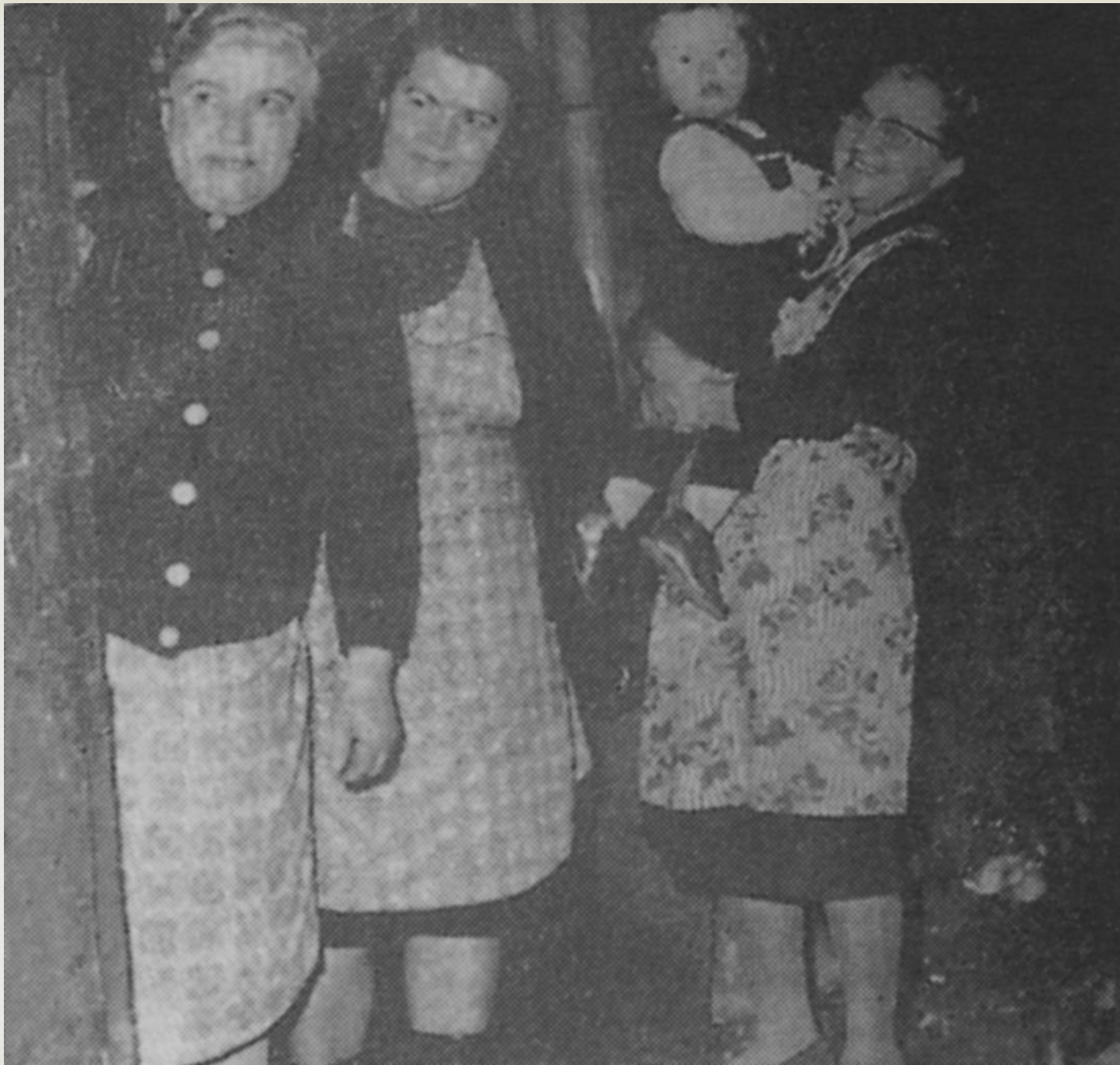
TAH 1967-02-04 Arholzen