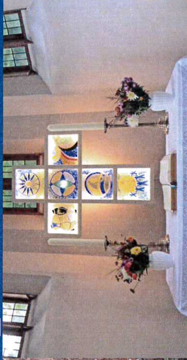
H Evang. Kirche mit Glasfusingkreuz im Altarbereich