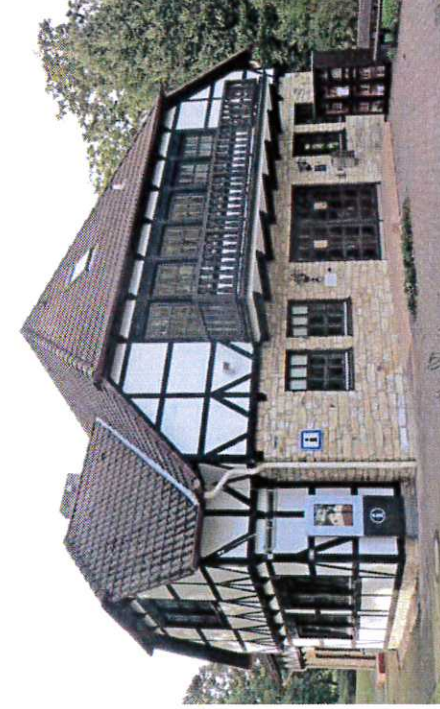
A Touristinformation / Glasmuseum