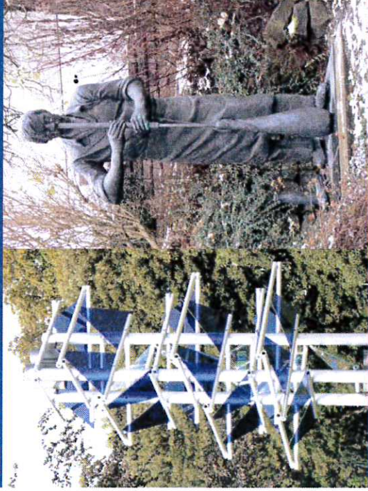
C Glasmachersippenbaum E Glasmacherdenkmal